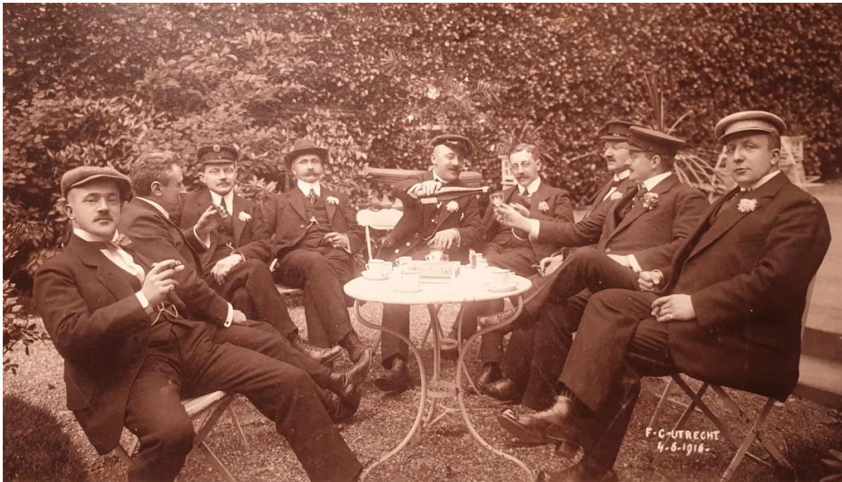
De Kegelclub "Westfalia" Amsterdam