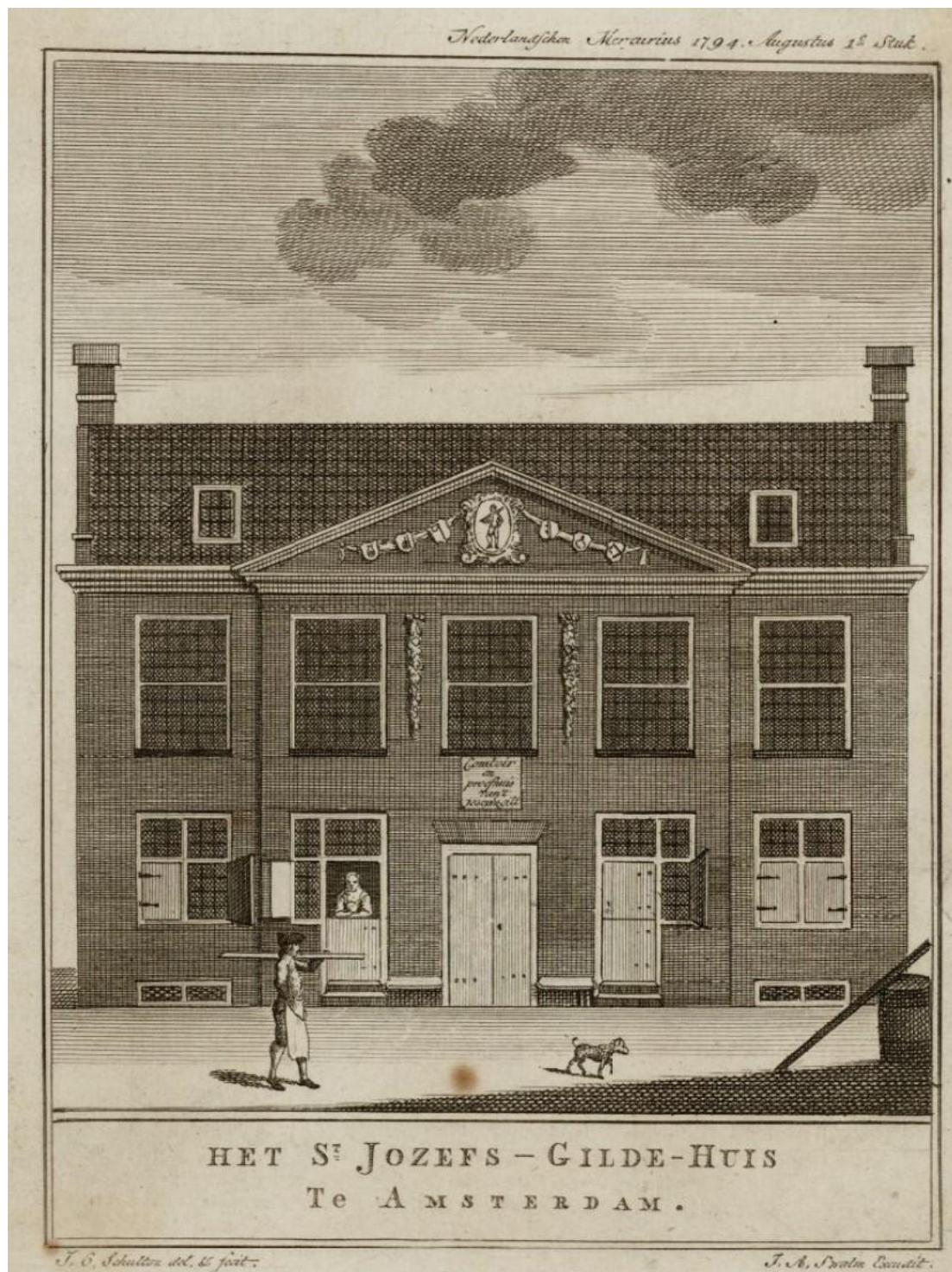
Reguliersdwarstraat 52-54 in 1794

Een der leden zou voorlopig naar Italië gaan, doch bleef halverwege hangen en het volgend jaar was er geen dame meer aan het souper.