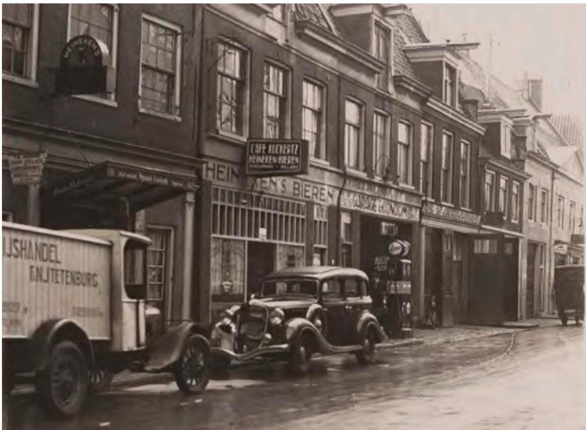
Geheel rechts: Zum Franciskaner, Reguliersdwarstraat 54 in 1936

De Penningmeester reeds uit anderen hoofde daar aanwezig bewees hem bij de begrafenis de laatste eer. De 6 de november werd er een vergadering gehouden in de Franciskaner wat men in deze zoude doen.