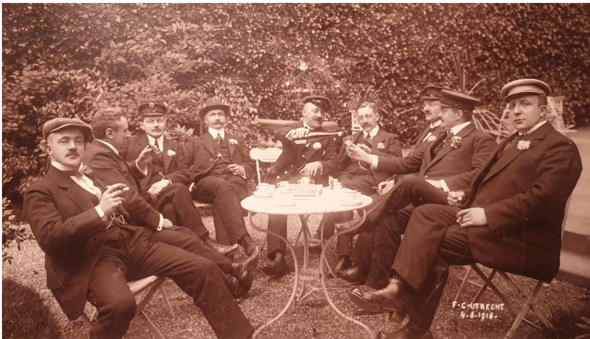
Der Kegelclub "Westfalia" Amsterdam